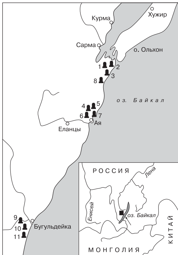
Рис. 1. Район исследований.

Пещеры: 1 – Бол. Байдинская, 2 – Мал. Байдинская, 3 – Мечта, 4 – Ая, 5 – Рядовая, 6 – Вологодского, 7 – Октябрьская, 8 – Скотомогильник, 9 – Загадай, 10 – Бурун, 11 – Бурун-ледяная.