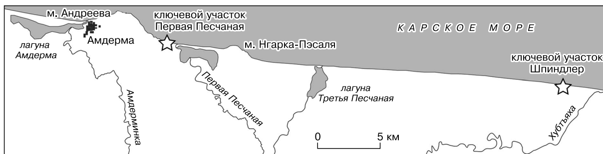
Рис. 1. Ключевые участки изучения термоденудационных процессов на Югорском полуострове.

побережья восточнее пос. Амдерма протяженностью около 46 км [Кизяков, 2005; Кизяков, Лейбман, 2005; Лейбман и др., 2000; Cherkashov et al., 1999]. Район находится в зоне сплошного распространения многолетнемерзлых пород с температурой -3...-5\text{ }^{\circ}\text{C} и мощностью 100–400 м [Геокриология СССР..., 1988]. Глубина сезонного протаивания составляет в среднем 0,8–1,0 м, однако в торфе снижается до 50 см, а в песке может превышать 1,5 м.