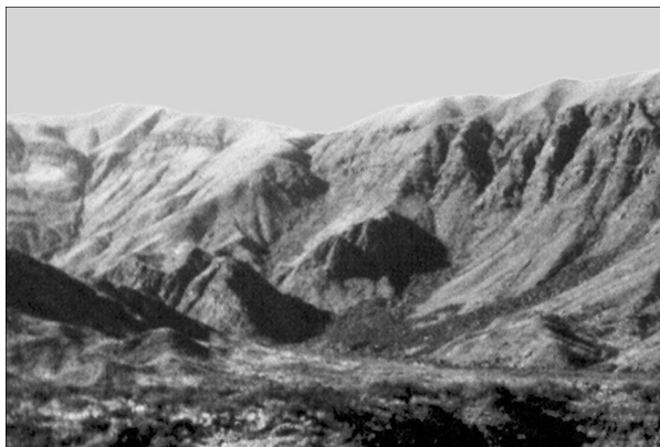
Рис. 2. Плиоценовые кары в Прекордильере.

По мнению А. Кортэ, возраст древних каменных глетчеров раннеплейстоценовый. Согласно байкальским материалам, наиболее суровый криохрон отмечался около 600 тыс. лет назад, когда в Сибири температуры воздуха были ниже современных на 10–15 °С [Фотиев, 2005б]. Похолодание в этот криохрон сопоставимо с плиоценовым, но оно не сопровождалось аналогичным по мас-