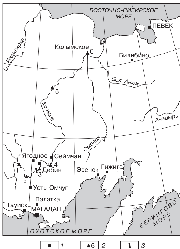
Рис. 1. Схематическая гидрографическая карта Северо-Востока России:

Для достижения намеченной цели использованы данные о зимнем стоке р. Колымы, которые получены в результате многолетних наблюдений на гидрометрических постах территориальных управлений по гидрометеорологии и мониторингу окружающей среды – Колымского (КУГМС), Якутского (ЯУГМС), Чукотского (ЧУГМС). Эти сведения опубликованы в ежегодных изданиях Государственного водного кадастра, вып. 17 [2009]. Среднемесячные, среднегодовые расходы реки и другие гидрометрические показатели взяты из справочника “Многолетние данные о режиме и ресурсах поверхностных вод суши” [1985]. Используются также результаты полевых и камеральных работ авторов и другие, данные геокриологических, инженерно-геологических и гидрогеологических исследований в долине Колымы в период с 1932 по 2008 г., представленные в отчетах, храня-