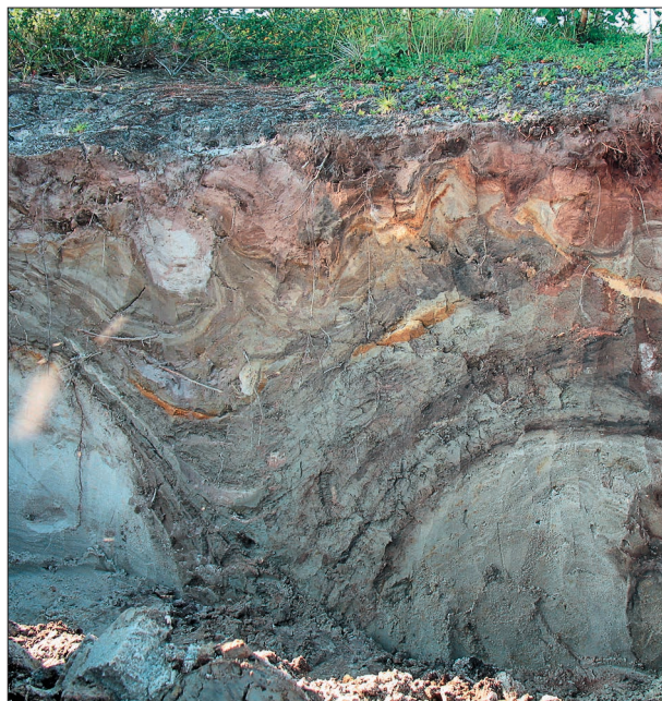
Рис. 2. Суглинистая псевдоморфоза в разрезе бугра, расположенного на III озерно-аллювиальной равнине.

III озерно-аллювиальная равнина. Буровая скважина глубиной 10,2 м, заложенная на вершине бугра, вскрыла торфяной горизонт мощностью 0,48 м. Далее до глубины 0,9 м залегает супесь. В интервале 0,9–1,05 м расположен прослой песка. Следующий горизонт сложен супесью и залегает до глубины 1,57 м. Криогенная текстура в верхней части разреза чаще массивная, местами микрошлировая. Далее до глубины 7,2 м залегает массивно-мерзлый песок. Нижний горизонт (7,2–10,2 м) представлен льдистым суглинком. Для него характерна сетчато-слоистая криогенная текстура с толстыми горизонтальными (рис. 3, а) и тонкими вертикальными шлирами льда (см. рис. 3, б). Объемная льдистость за счет ледяных включений в данном горизонте составляет 35%. Суммарная мощность включений льда во вскры-