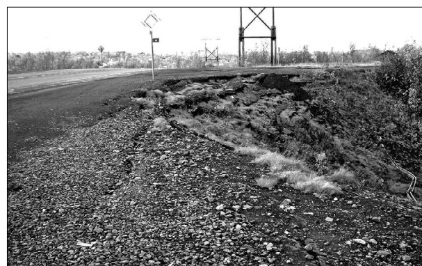
Рис. 5. Ступенчатое отседание откосов и основной площадки насыпи автомобильной дороги Норильск–Талнах 10-й километр трассы, сентябрь 2010 г.

1 – >5 °С/м; 2 – 1–5 °С/м; 3 – 0.3–1.0 °С/м; 4 – <0.3 °С. Линиями отображено положение фронта промерзания в теле насыпи на конец каждого месяца сезона охлаждения; 5 – кровля многолетнемерзлых пород.