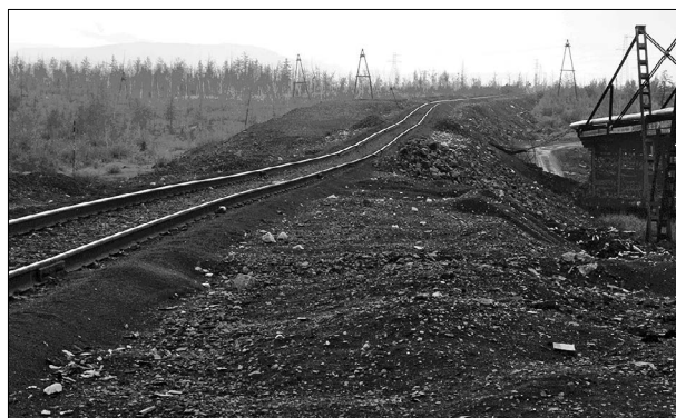
Рис. 2. Продольная просадка высокой насыпи на железной дороге у разезда “Валёк”.

Отепляющее влияние насыпи, а также снега и воды, скапливающихся в котловинах, эффективнее всего компенсировать применением СОУ, поскольку изменение условий теплообмена через поверхность, направленное на повышение отрицательных теплооборотов, либо слишком трудоемко (расчистка снега на примыкающих участках и исключение его накопления в котловинах), либо сложно осуществимо (дренаж территории). Такие установки в данном регионе успешно применены для обеспечения устойчивости объектов гражданского назначения и ряда гидротехнических соору-