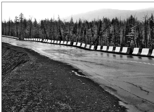
Рис. 3. Формирование локальной просадки основной площадки насыпи на участке неисправной водопропускной трубы.

В ходе обследования автомобильной дороги Норильск–Талнах отмечено развитие локальных просадок сложной конфигурации, которая, вероятно, повторяет форму каналов под насыпью, где идет дренирование. С точки зрения безопасности движения такие участки локальных просадок более опасны, чем продольные просадки высоких насыпей, поскольку они вызывают резкие перепады